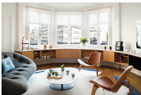
Équipements et confort