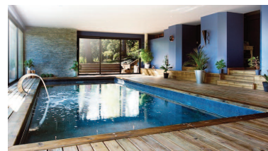
Restructuration des volumes