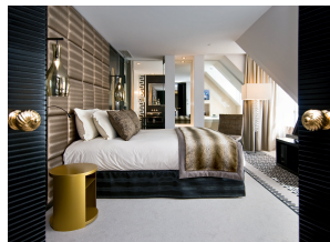
Lumière et ambiance